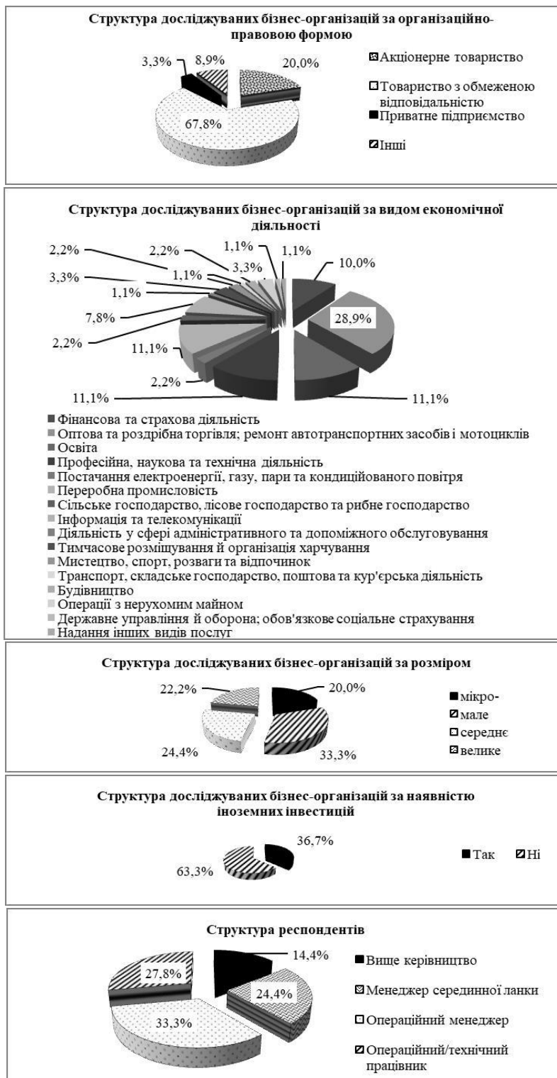
Рис. 1. Структура досліджуваних бізнес-організацій та респондентів, %