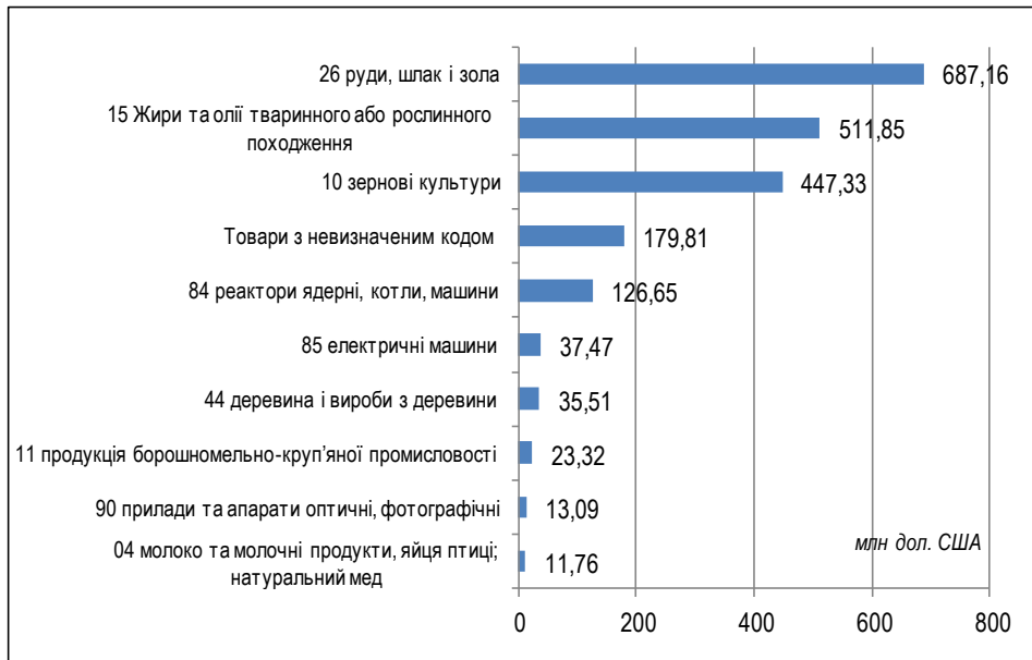
Рис. 3. Топ-10 товарів вітчизняного експорту в Китай у 2017 р., млн дол. США

важно соняшникова олія, її частка становила 89% експорту олій і жирів у Китай у 2017 р. Частка соєвої олії, що в Китаї є традиційним продуктом споживання і тому має найкращі перспективи щодо розвитку експорту, у вітчизняному експорті олій і жирів у цю країну поки що незначна – 9,3% у 2017 р.