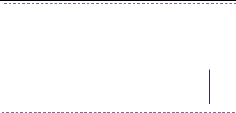
Рис 2. Типи комплементарної дії на процеси розвитку