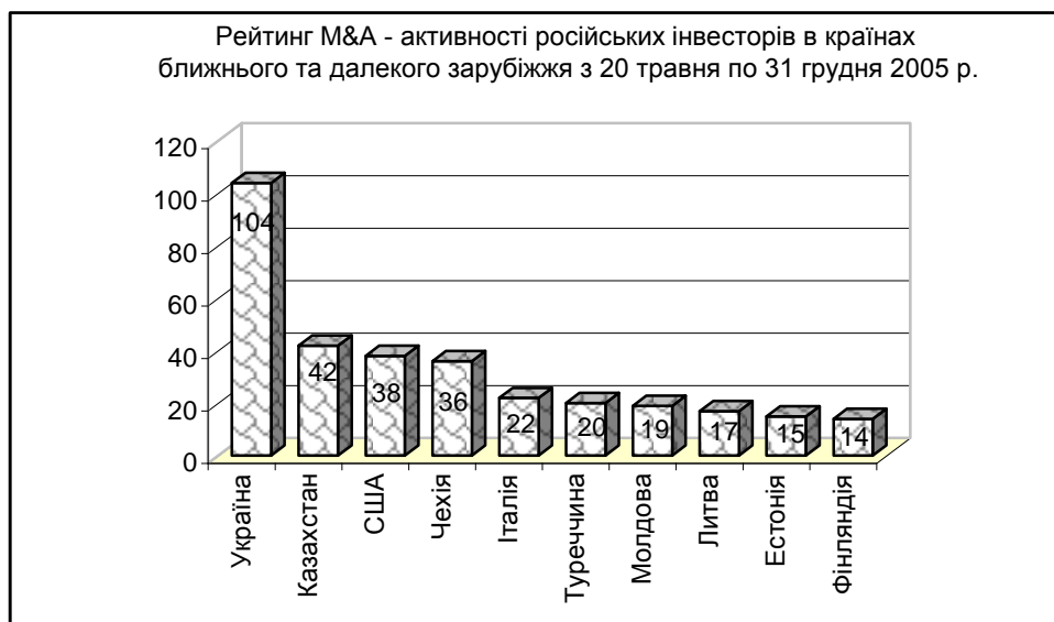
Рис. 1. Рейтинг злиття-поглинання активності російських інвесторів

ки, на думку російських експертів, на всьому пострадянському