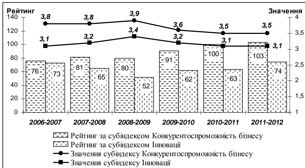
Рис. 1. Динаміка зміни складових групи субіндексів "інновації" та "конкурентоспроможність бізнесу" для України

Здійснений нами порівняльний аналіз рейтингів Індексу глобальної конкурентоспроможності за факторами інноваційності (рис. 1) дозволив зробити узагальнений висновок щодо руху України на шляху зростання конкурентоспроможності: зазначений процес у динаміці непостійний, відбувається на фоні складного за поведінкою бізнес-середовища, через відсутність дієвої та послідовної державної політики наявний науково-технологічний та інноваційний потенціал не реалізується як рушійний фактор, що позначається на низькому рівні економічного розвитку країни.